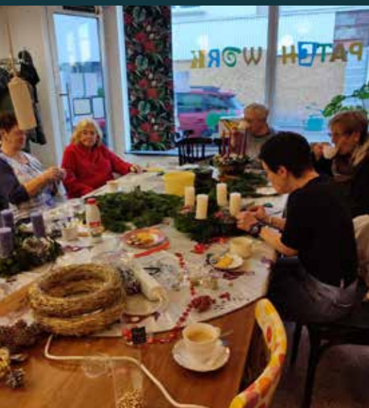
Adventsbasteln St. Vith