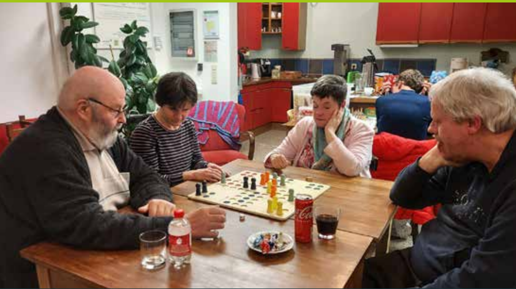
Spieleabend St. Vith